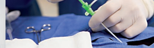
Programm & Danksagung